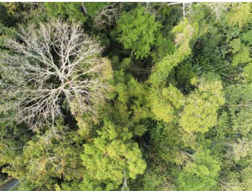
Bosque de Quebrada Félix, Darién, del proyecto Cartografía de los bosques del pueblo

Desde el año 2012, cada 21 de marzo celebramos el Día Internacional de los Bosques, proclamado por las Naciones Unidas. Para la celebración de este día, cada año se elige una temática específica y en el 2019 fue los bosques y la educación. En Panamá se realizó un evento oficial en el formato de un foro donde se reunieron representantes del Estado y organizaciones internacionales para renovar los compromisos adquiridos en la protección de los bosques de todo tipo en el territorio panameño, como la aprobación de la Estrategia Nacional Forestal 2050 para Panamá del Ministerio de Ambiente.