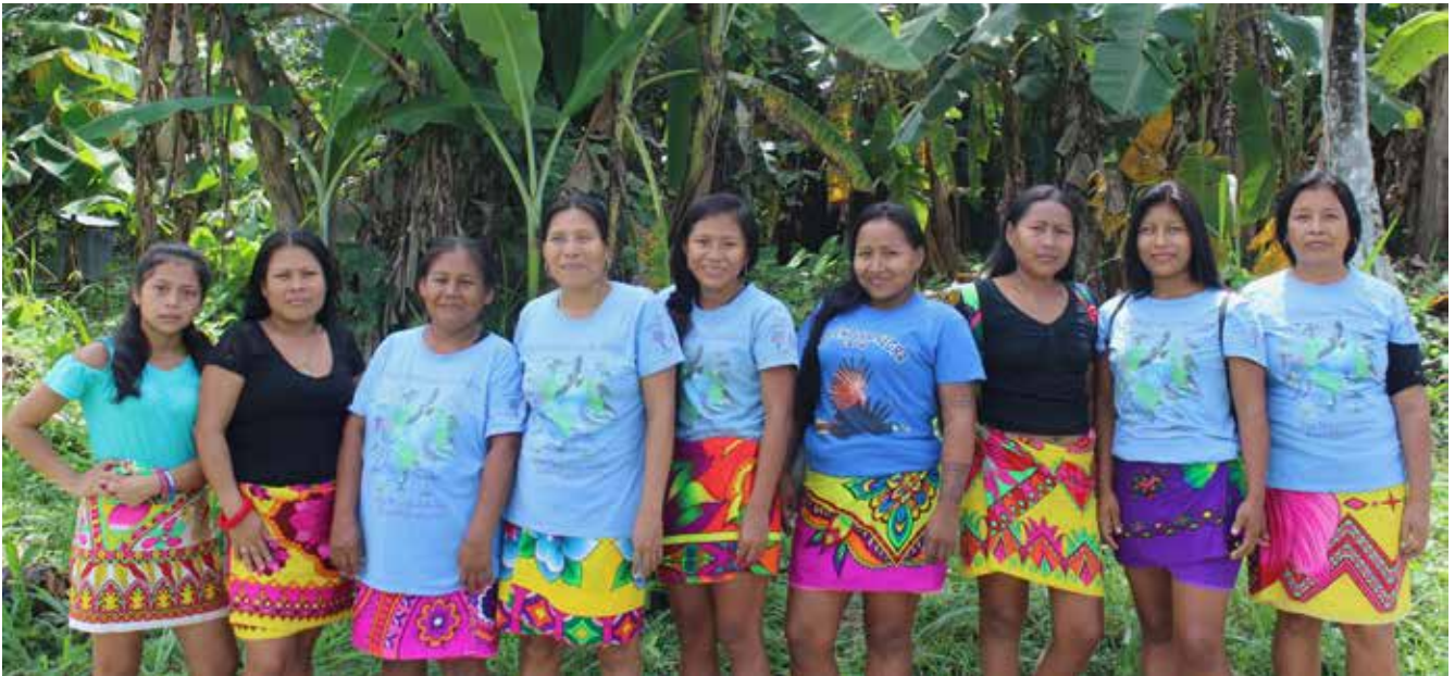
Tangaras Azules, grupo de conservación y avistamiento de aves en Puerto Lara, Darién.

El Programa de Pequeñas Donaciones trabaja desde una perspectiva de género, que es transversal a todos sus proyectos. Esto quiere decir, entre otras cosas, que en todas nuestras líneas de trabajo se está actuando en la reducción de la brecha existente entre hombres y mujeres; en términos del acceso a oportunidades que mejoren el bienestar individual, comunitario y del entorno natural en el que vivimos.